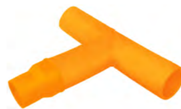
SDR - 17 SDR - 17,6 SDR - 11