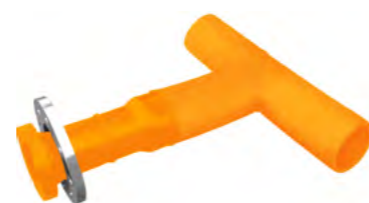
SDR - 17 SDR - 17,6 SDR - 11